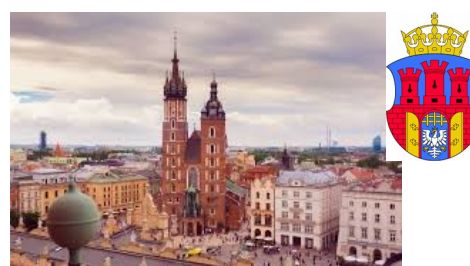
KRAKÓW i o Popielu