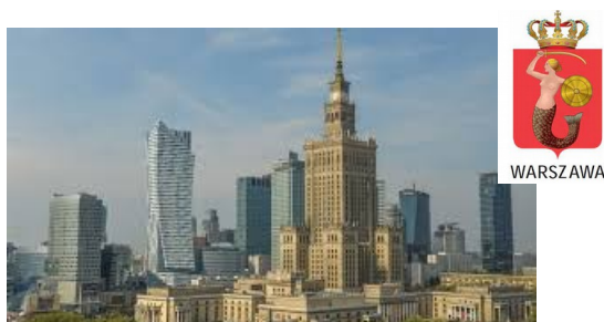
WARSZAWA i o Bazyliiszk